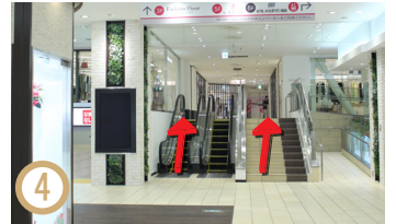
4 直走到“蒙特雷”，您會看到一個自動扶梯和樓梯在您面前（如果您有後備箱，請使用自動扶梯或斜坡）。上去，右邊的服裝店後面有一部電梯A，因此請上到六樓的酒店大堂/前台。（這部電梯將營業至24:30）