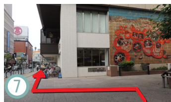
7 到達達魯瑪壁畫時，沿著建築物的路繼續行駛。