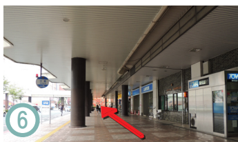
6 如果您右轉，便可以看到便利店。請直接去後面的達魯瑪壁畫。