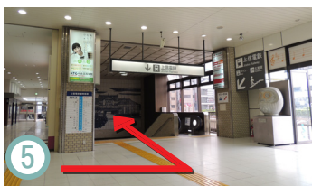
5 24:30之後。在大廳西出口的盡頭，沿著您左邊的樓梯下樓，然後一次出門。