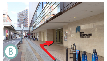
8 大約30m後，您將在右側看到高崎大都會酒店的正門。請進入入口，乘電梯到6樓的大堂接待處。