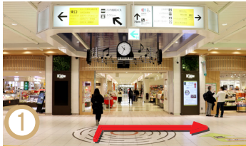
1 如果您從新幹線檢票口直接去，您會在前面的頂部找到JR指南。您還可以在西出口方向看到高崎大都會飯店的展品。沿著大廳向西出口行駛。