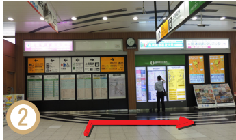
2 從JR高崎站檢票口出來時，可以看到前方的鋼琴形鐘。沿著大廳向右走，向西出口。